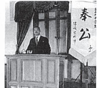
写真撮影時（1939年） 講演者は小磯国昭・拓務大臣